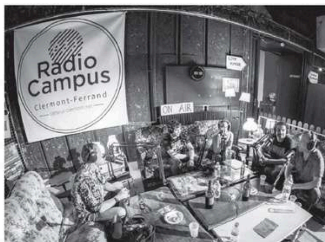
L'équipe de bénévoles gère les gros événements

Cette année, la Maison de la Culture aura l'honneur d'accueillir ces joyeuses festivités les 18 et 19 avril. À l'image une longue soirée où les invités ne voudraient jamais repartir, un marathon radiophonique de 30h animera les débats, donnant le micro à la crème musicale de notre territoire (dont certains commencent à se faire un nom à l'échelle nationale), tout style confondu. La musique puydômoise, Radio Campus en connaît un rayon à la faveur de son rendez-vous hebdomadaire du jeudi soir, le « Live in Room »,