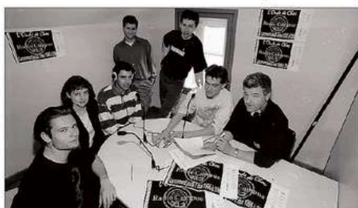
SOUVENIR. Une exposition de photos retracera l'aventure de Radio Campus Clermont (ici le 1 er mai 1996, veille de la première diffusion).

Rendez-vous est donné sur les ondes (93.3 FM) et sur le site internet campus-clermont.net mais aussi sur place avec de nombreux rendez-vous festifs.